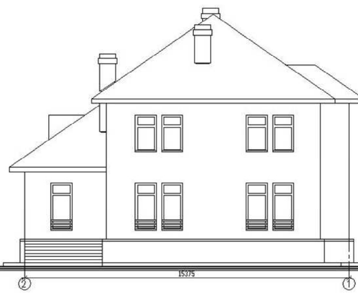
Фасад в осях 2-1