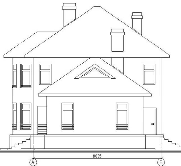
Фасад в осях А-Б