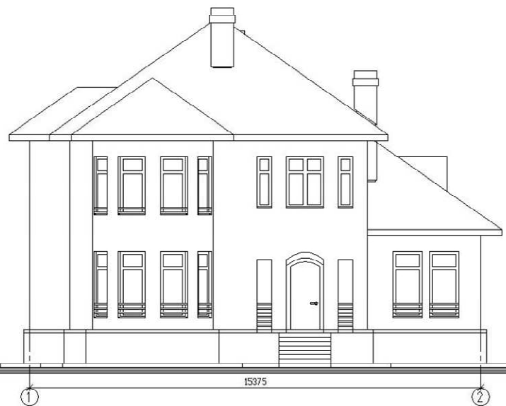
Фасад в осях 1-2