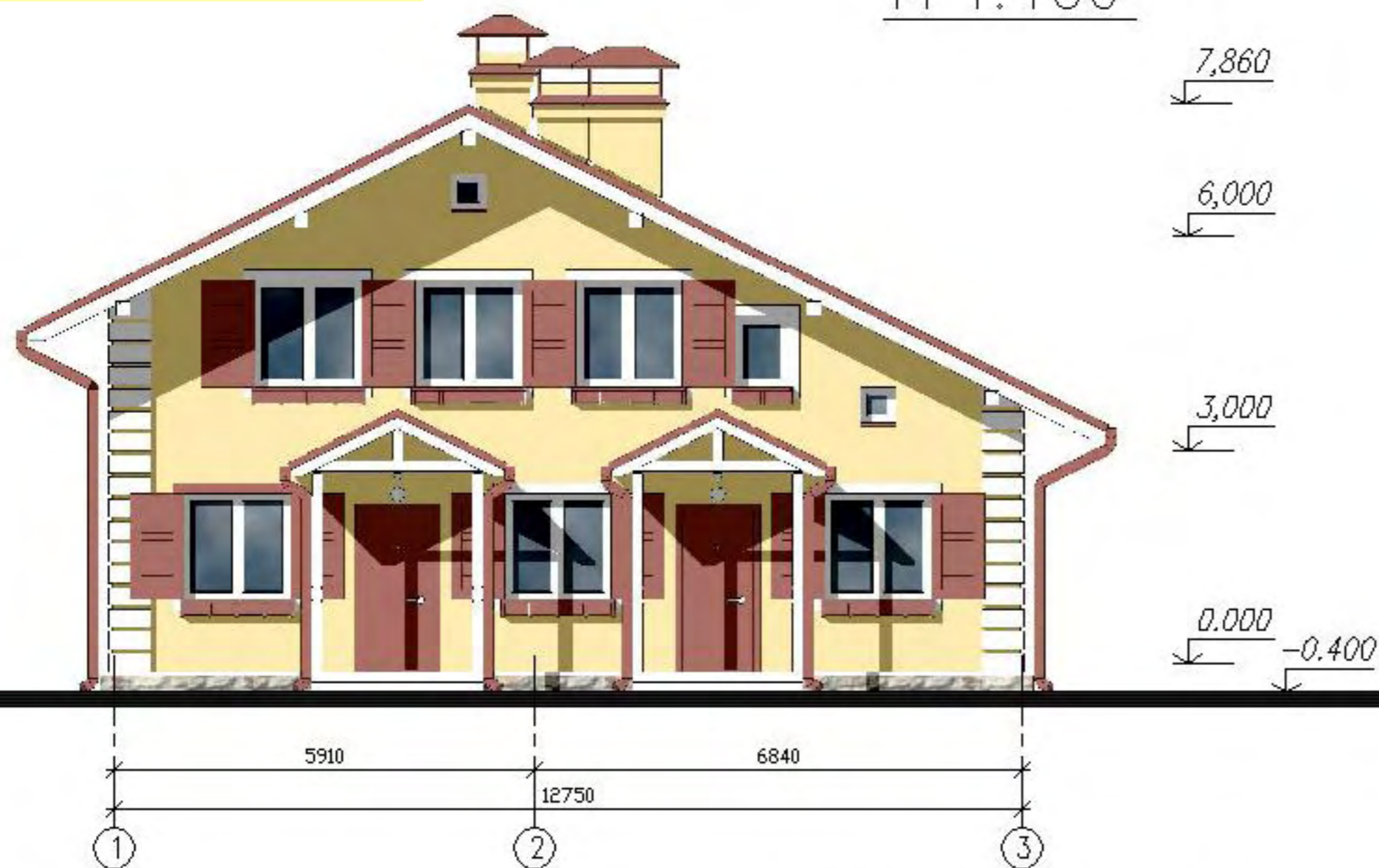
Фасад в осях 1—4 М 1:100