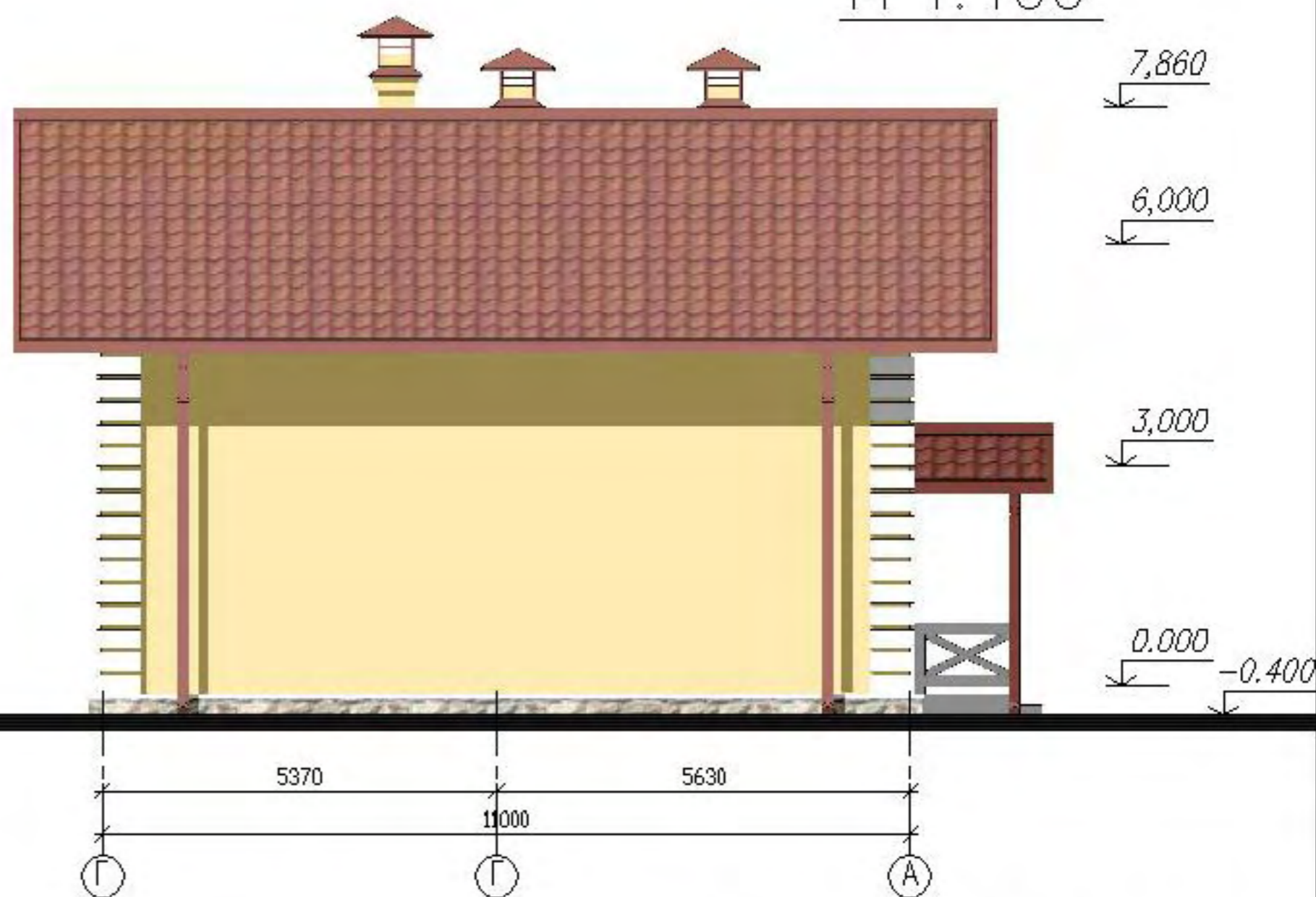
Фасад в осях Г—А М 1:100