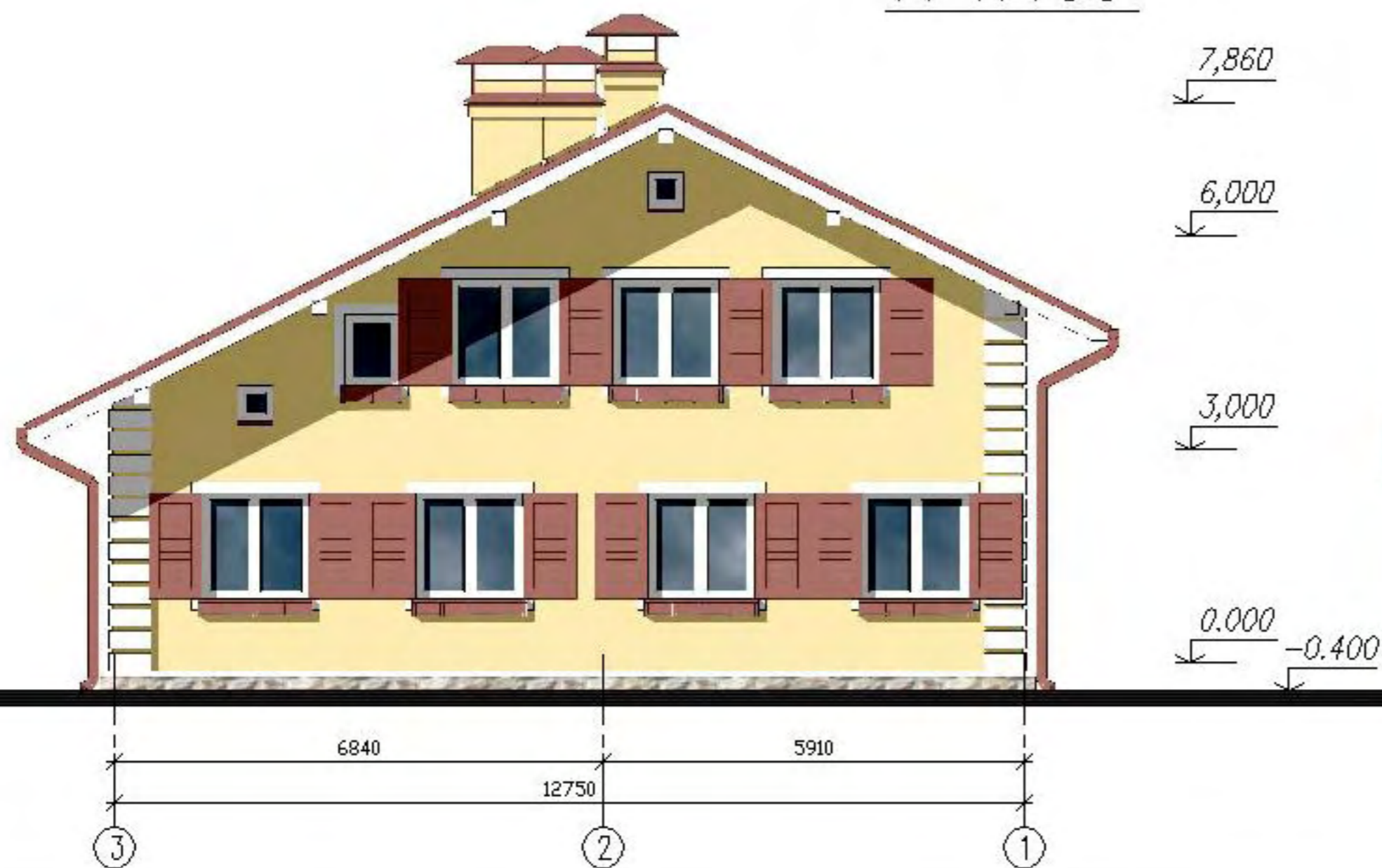
Фасад в осях 4—1 М 1:100